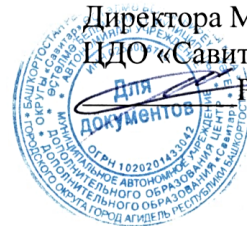
График прохождения курсов повышения квалификации педагогических работников МАУ ДО ЦДО «Савитар» на 2023-2024 учебный год